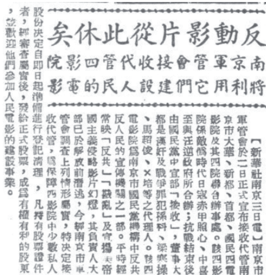
图1.《大公报》刊登“南京军管会接收接管四大影院”新闻 ①

商局的要求，对所发给许可证的影剧院进行清册，同业公会在国民党政府时期作为民间组织，主要承担着协同政府监督与引导各大影院内部运营与外部沟通的职能。此次名册详尽到负责人姓名、地点、资本、创设年月、许可证字号及债务状况。南京各大小影院在这次清册中被记录在案，“全市专业电影院共计7处，其中新都大戏院、首都大戏院、国民大戏院、大华大戏院、4家为国民党政府公营影院，其余3家大光明大戏院、世界大戏院、新亚大戏院均为独资或合资创办” ⑧ 。此次清册任务是按照中央人民政府文化部的指令进行的，不但是对南京影院全面的清册与登记，也有助于之后全市电影院的社会主义改造 ⑨ 。1949年7月30日，文化剧院改名为文化电影院后开幕，成为南京市第一家正式的公私合营电影院，专为“工人、战士、干部、学生服务，专映政治教育性的文艺性影片” ⑩ 。1949年12月7日，中央电影局为发展“人民电影”，将军管处改属华东影片公司南京办事处“为发展人民电影和广大南京区影片发行业务，特设立南京办事处，业务范围为管理原南京市电影戏剧管理处所辖五大影院及接收的各制