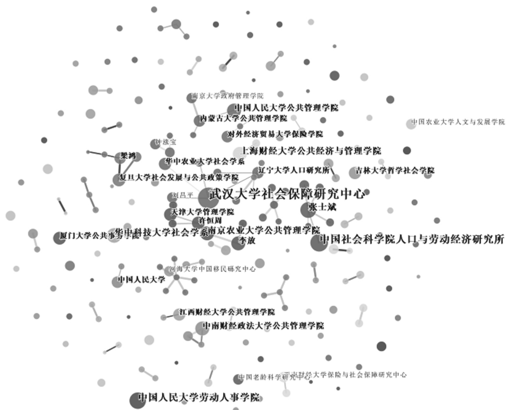
图 2 养老政策领域合作机构与合作作者共现网络