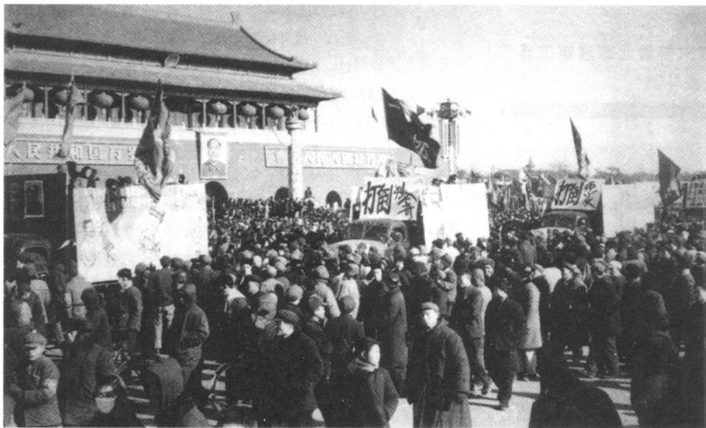
1966年12月25日，清华大学红卫兵在天安门前游行时，公开打出“打倒刘少奇”、“打倒邓小平”的标语。