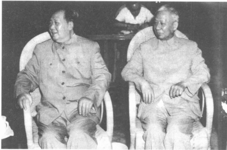
毛泽东和刘少奇在一起。

刘少奇在这个“检查”中回顾了一年前毛泽东不在北京期间，他和邓小平主持中央工作时代向北京大学派工作组的问题。刘少奇说：“毛主席不在北京时，是毛主席、党中央委托我主持党中央日常工作的。由于我在