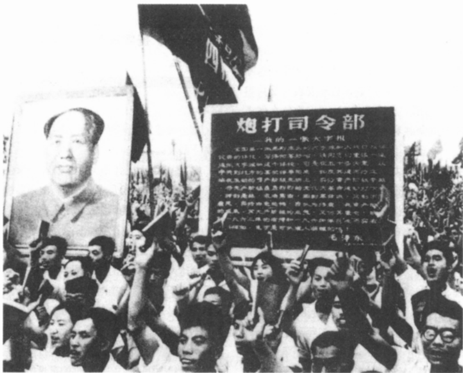
1966年8月5日，毛泽东发表《炮打司令部——我的一张大字报》。图为群众高举毛泽东所写的大字报进行游行。

1967年4月1日，戚本禹在《红旗》杂志第七期上发表了一篇当时被称为“讨刘战斗檄文”的长篇文章《爱国主义还是卖国主义？——评反动影片〈清宫秘史〉》。其实，在戚本禹发表这篇长文半个月前，刘少奇就已经感到来自中央文革小组的威胁了。早在1966年9月，刘少奇就针对毛泽东在杭州期间他和邓小平主持中央工作期间，向北京各大院校派工作组等问题作过一次认真的“检查”。当