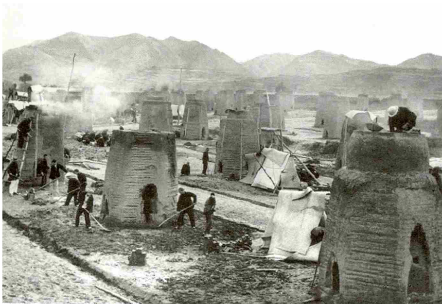
蜂拥而起的小高炉

有煤铁资源的地方安营扎寨，全区先后共组织远征军近万人。全区搞钢铁的干部和群众，经常保持在 20 万人左右。在钢铁“淮海战役”中，人数达到 30 万，占全区 42 万总劳动力的 70%。