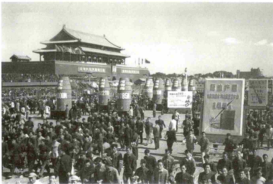
1958年国庆节，游行的人们抬着土高炉，以示炼出1070万吨钢的决心