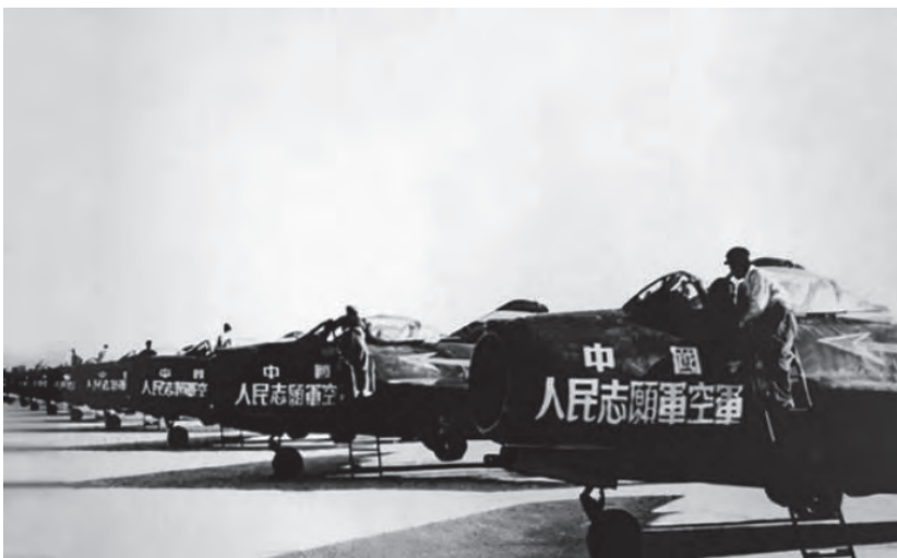
◇抗美援朝出国作战的中国人民志愿军空军部队

国防现代化首先是武器装备的现代化，武器装备现代化是国防现代化的标志。中国国防尖端武器的研制，离不开周恩