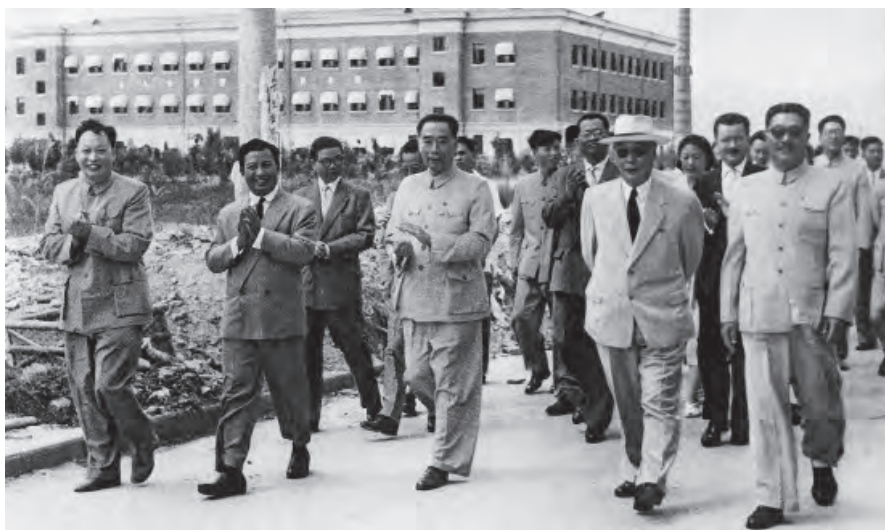
◇1958年8月，周恩来和陈毅、贺龙等陪同外宾参观中国第一个综合性原子核科学技术研究基地——中国科学院原子能研究所

绿江口起，南到北仑河口止，绵长得很啊。因此，我们一定要建立一支‘海上长城’。”1957年8月，为庆祝建军30周年，周恩来在青岛代表毛泽东检阅海军部队时指出：“必须继续努力，为建设一支坚强的足以自卫的海军力量，保卫祖国，保卫亚洲和世界和平而奋斗。”